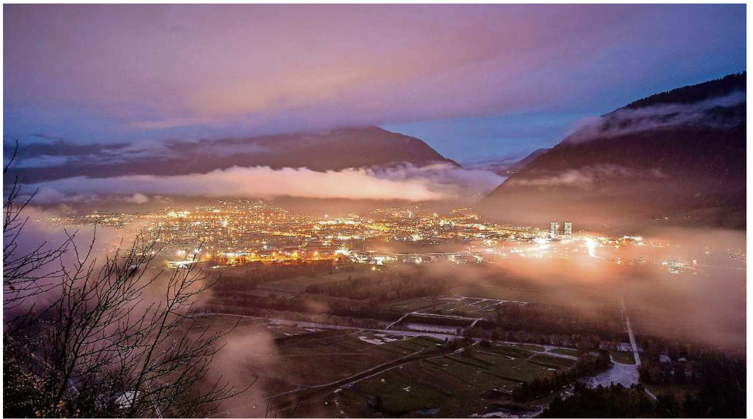
So hell wie 7,5 Vollmonde : Am Abend bildet sich über Chur durch die vielen Aussenbeleuchtungen eine Lichtlocke.